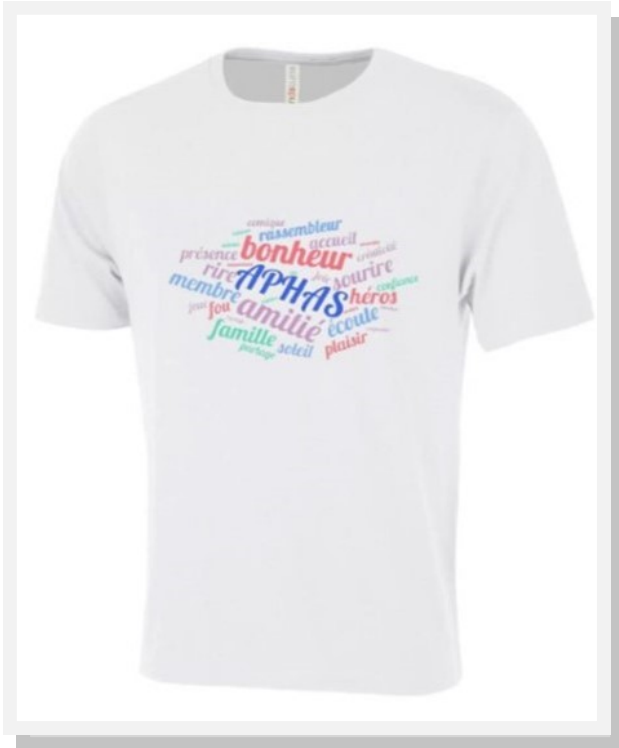
T-Shirt Homme « Hymne des Héros »

*Voir grandeur p.11 tableau B (Homme) & tableau C (Femme)