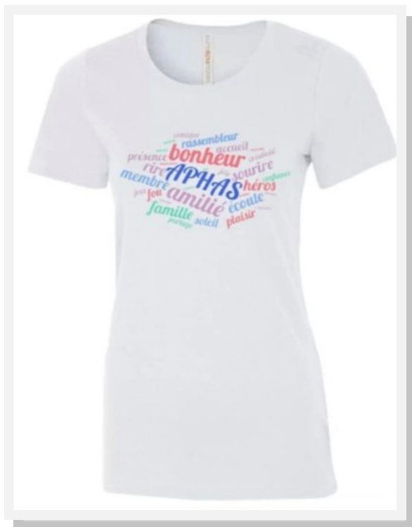
T-Shirt Femme « Hymne des Héros »