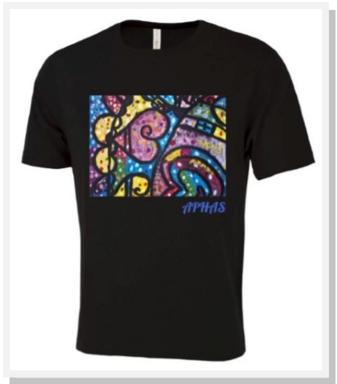
T-Shirt « Notre Mandala » Homme