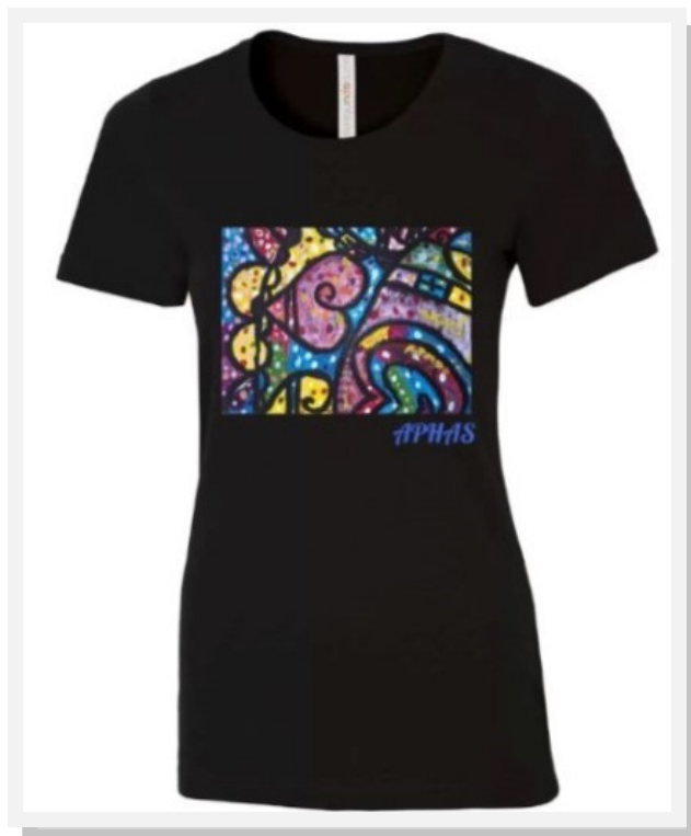
T-Shirt «Notre Mandala» Femme